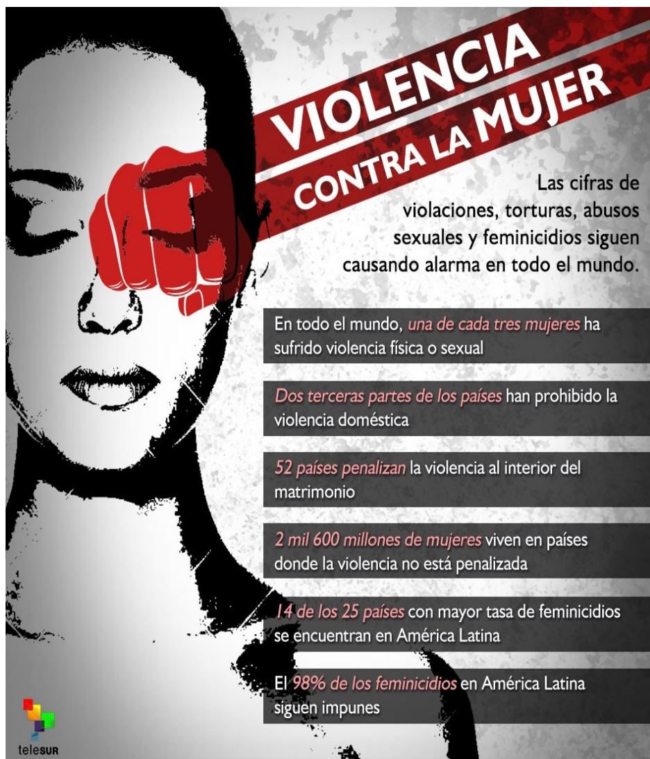
Gráfico afiche Telesur

En América Latina es un riesgo ser mujer. El lugar de mayor inseguridad es la casa y la persona más peligrosa es la pareja. Se dice pronto, pero de los 25 países del mundo con las tasas más altas de feminicidio, 14 son de América Latina y 3 del Caribe [1]. Y la impunidad llega al 98%.